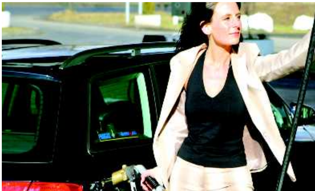
Umrüsten ist überhaupt kein Problem. Der Profi-Kfz-Betrieb, der auf Umrüstung spezialisiert ist, berät Sie gerne über Preise und Konditionen.