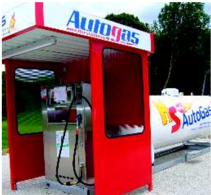
Die neue Autogas-Tankstelle in Riedenburg ist 24 Stunden, rund um die Uhr also, benutzbar.